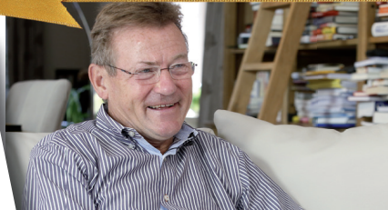
Johan Van Overtveldt